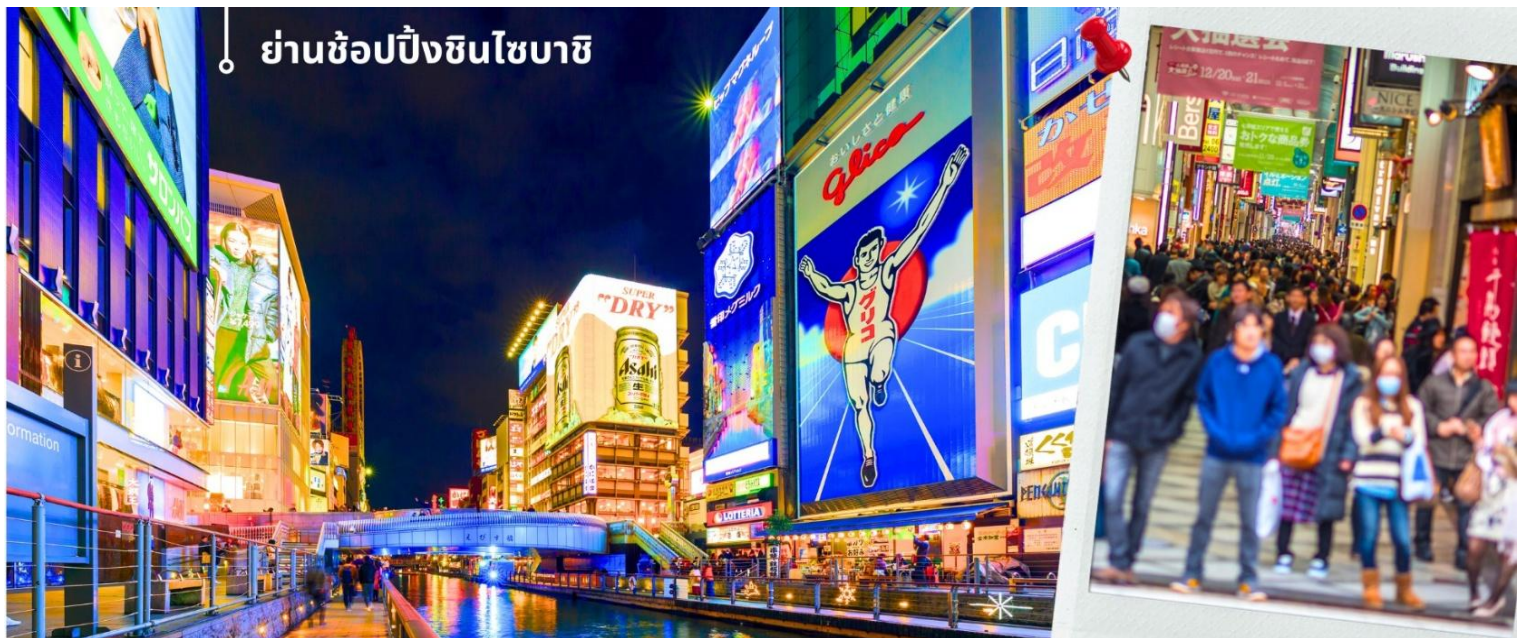
ย่านช้อปปิ้งชินไซบาชิ

พอสมควรแก่เวลานำท่านเดินทางไปยัง ย่านช้อปปิ้งชินไซบาชิ ชื่อตั้งของโอซาก้า มีร้านค้าทั้งเก่าแก่และทันสมัย สินค้าหลากหลายรูปแบบสำหรับเด็กและผู้ใหญ่ เป็นย่านแสงสีและความบันเทิงอีกแห่งหนึ่งของโอซาก้า อีกทั้งยังมีร้านอาหารขึ้นชื่อมากมาย ซึ่งเสน่ห์ อย่างหนึ่งของที่นี่คือ ร้านจะประดับตกแต่งร้านของตนเองด้วยแสงไฟนีออนซึ่งจัดทำให้เป็นรูปบู๊กิ้ง และปลาหมึก ซึ่งนักท่องเที่ยวให้ความสนใจและแวะถ่ายรูปกันเป็นที่ระลึก