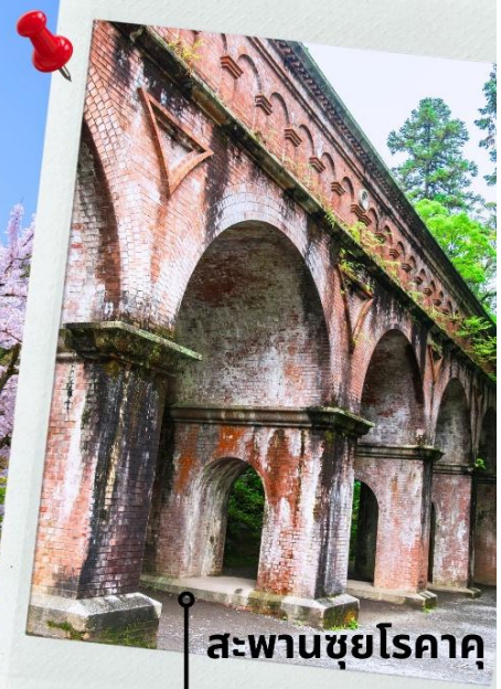
สะพานชุยโรคาคู

** ระยะเวลาการบานของดอกซากุระจะขึ้นอยู่กับสายพันธุ์และสภาพอากาศ **