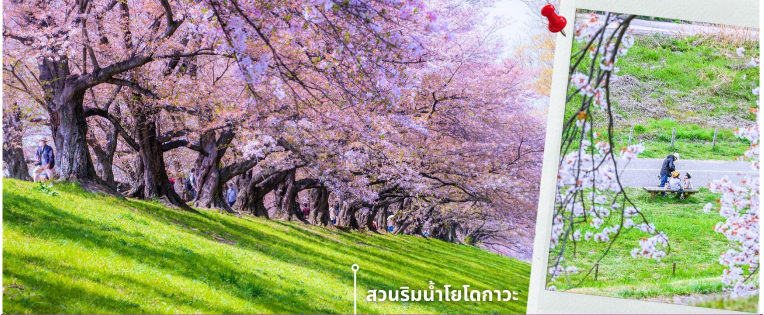
สวนริมน้ำโยโดกาว่า

นำท่านเดินทางชมดอกซากุระบานที่ สวนริมน้ำโยโดกาว่า เป็น สถานที่ชมดอกซากุระริมน้ำอีก1จุดยอดนิยมของเมือง ที่มีต้นซากุระมากถึง 250 ต้น เรียงกันอยู่2ข้างทาง ความยาวกว่า 1.4 กิโลเมตร ดูราวกับอุโมงค์สีชมพูที่สวยงาม พร้อมวิวทิวทัศน์ฝั่งตรงข้ามที่เป็นแม่น้ำทอดยาวออกไป ให้ความรู้สึกและบรรยากาศแสนจะโรแมนติก และสวนแห่งนี้ยังมีพื้นที่สำหรับการวิ่งจ็อกกิ้ง เดินเล่น และสามารถมาปิกนิก พักผ่อนและผ่อนคลายจากความเหนื่อยล้าได้ ให้ท่านอิสระถ่ายภาพและเดินชมบรรยากาศตามอัธยาศัย