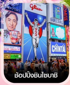
ช้อปปิ้งซินไซบาชิ

คอนเฟิร์มออกเดินทาง ทุกพีเรียด 2 ท่านขึ้นไป