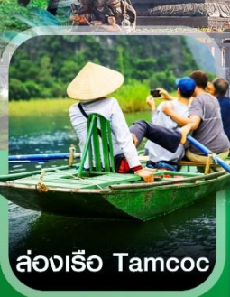
ล่องเรือ Tamcoc

✈️ คอนเฟิร์มออกเดินทาง ✈️ ทุกพีเรียด 2 ท่านขึ้นไป