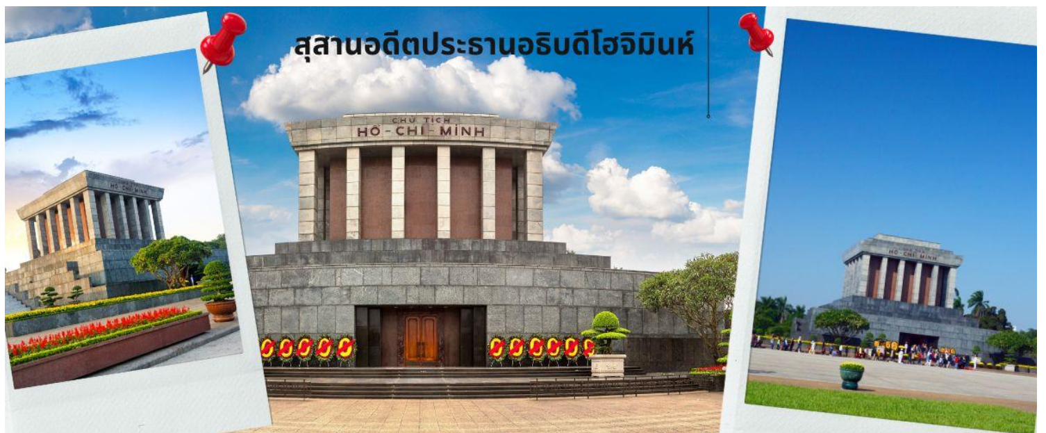
สุสานอดีตประธานาธิบดีโฮจิมินห์

จากนั้นนำท่านเข้าสู่ สุสานอดีตประธานาธิบดีโฮจิมินห์ (ชมด้านนอก) อยู่ที่ จัตุรัสบาติงห์ ใจกลางกรุงฮานอยเป็น สถานที่ที่เก็บศพภายในบรรจุศพอาบนํ้ายาของโฮจิมินห์นอนสงบอยู่ในโลง