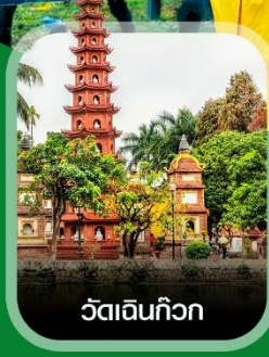
วัดเงินกิวก