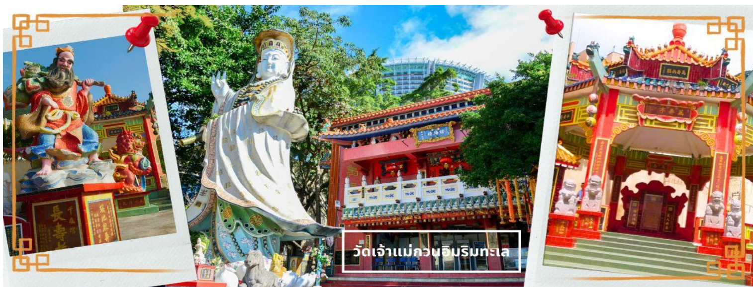
วัดเจ้าแม่กวนอิมรับทะเล

ที่สุดของฮ่องกง บริเวณวัดจะมี เจ้าแม่กวนอิมองค์ใหญ่ ปางประทานพรตั้งอยู่ เป็นเทพที่ชาวฮ่องกงและคนจีนให้ความเคารพนับถือมากที่สุด สามารถขอพรได้ทุกเรื่อง วัดนี้เป็นที่นิยมมีนักท่องเที่ยวเดินทางมาขอพรกันมากมาย เพราะเชื่อในความศักดิ์สิทธิ์ และยังมีเจ้าแม่ทับทิม หรือเทพธิดาแห่งท้องทะเลองค์ใหญ่ ซึ่งคนฮ่องกง คนมาเก๊า และคนจีน ที่อยู่ริมทะเล ชาวประมง นักเดินเรือหรือผู้ที่เดินทางทางเรือเป็นประจำ จะนับถือเจ้าแม่ทับทิมเป็นอย่างมาก มีความเชื่อว่าเจ้าแม่ทับทิมจะปกป้องเราจากภัยอันตรายระหว่างการเดินทาง ภายในวัดยังมีเทพเจ้าและพระพุทธรูปต่างๆ ประดิษฐานไว้มากมายตามความเชื่อถือศรัทธา เช่น เทพเจ้าไฉ่ซิงเอี้ย ไหว้ขอโชคลาภความมั่งคั่ง ความร่ำรวย, พระสังกัจจายน์ โพธิสัตว์ เทพประทาน บุตร-ธิดา ไหว้อธิษฐานขอลูก, สะพานต่ออายุ (สะพานอายุยืน) สะพานสีแดงตั้งอยู่บนริมหาด สีแดงสด เชื่อกันว่า คนจีนเชื่อกันว่าหากเดินข้ามสะพานนี้ เราจะมีอายุยืนขึ้นอีก 3 วัน (3 วัน บนสวรรค์ = 3 ปี บนโลกมนุษย์) นั้นหมายความว่า ถ้าเราเดินข้ามสะพานนี้แล้ว จะมีอายุยืนยาวขึ้นอีก 3 ปี บนโลกมนุษย์, เทพเจ้าแห่งความรัก ไหว้ขอเนื้อคู่, ศาลา 8 เหลี่ยม เชื่อกันว่าเป็นจุดที่มีดวงจ้ายดีที่สุด ภายในศาลาแปดเหลี่ยม จุดกึ่งกลางของพื้นจะมีรูป